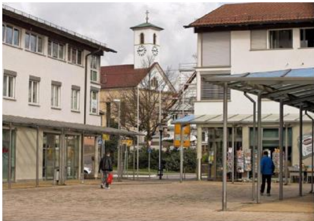
Start: Ortszentrum von Rommelsbach